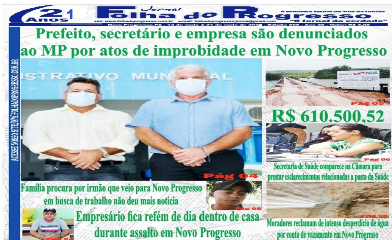
Capa Jornal Folha do Progresso