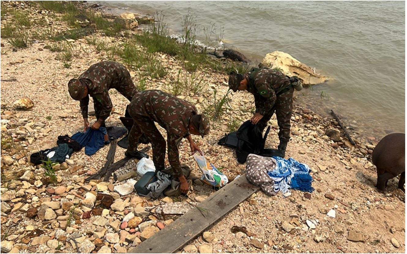
pertences das vítimas encontrados no rio Tapajós